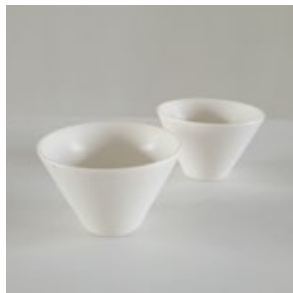
湯呑み / 小鉢