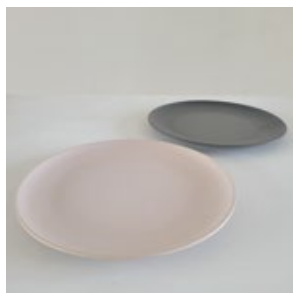
皿 _3( プラスチック )