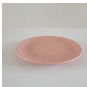
小皿 _3( プラスチック )