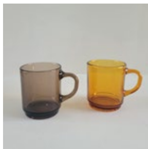
マグカップ_1( ガラス )