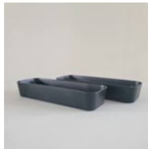
カトラリーケース