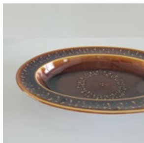
皿 _1( 陶器 )