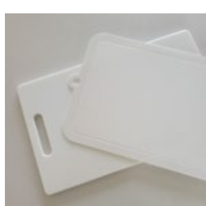
カッティングボード 2 種