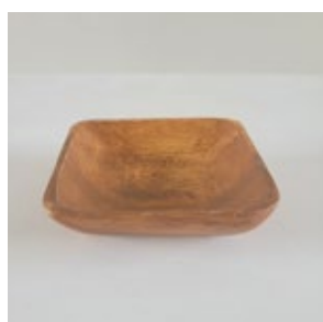
小皿 _3( 木製 )