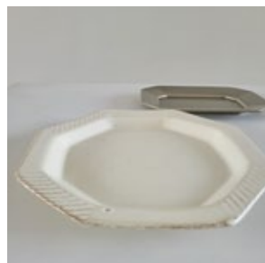
皿 _3( 陶器 )