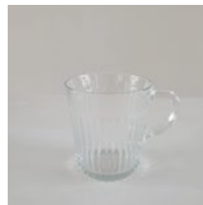
マグカップ_2( ガラス )