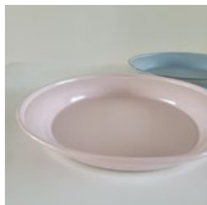
皿 _2( 陶器 )