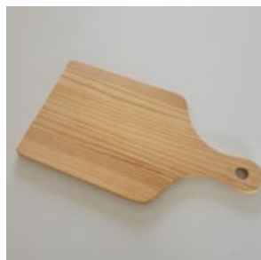
カッティングボード ( 木製 )