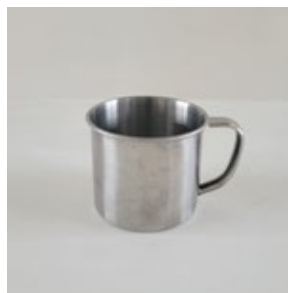
マグカップ_5( ステンレス )