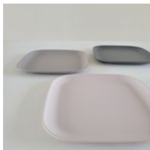
皿 _4( プラスチック )