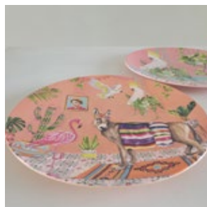
皿 _2( プラスチック )